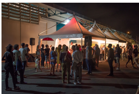
Vernissage du salon 2018 Extérieur du terminal de croisière sur le quai